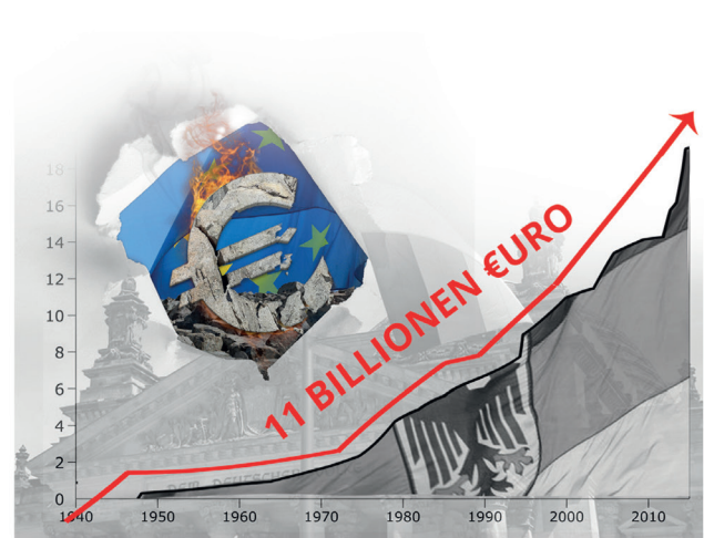
STAATSVerschULDUNG EURO DEUTSCHLAND